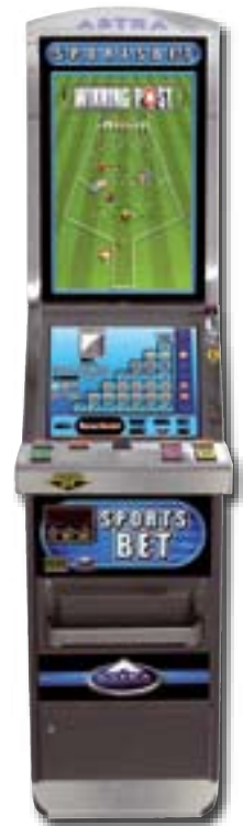
The new BetPod.