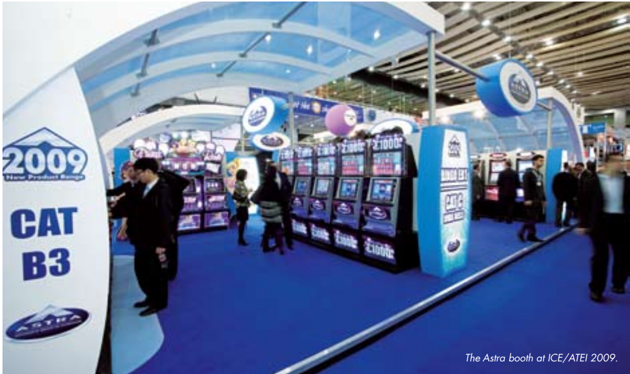
The Astra booth at ICE/ATEI 2009.