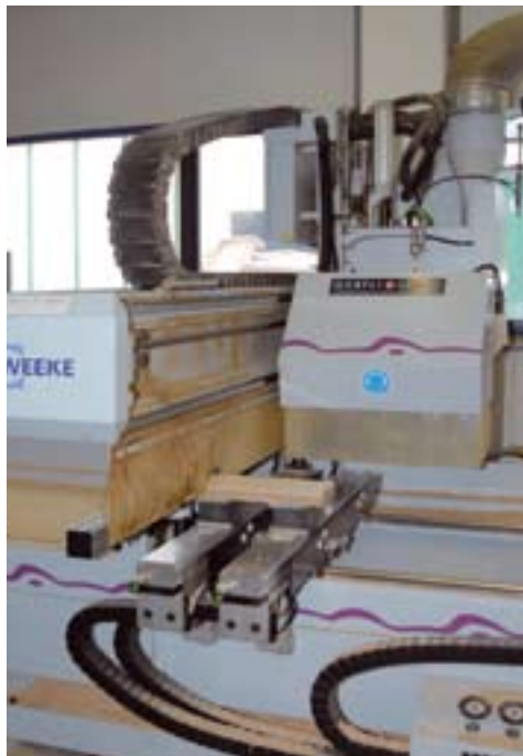
Top: the new warehouse, below: the automated milling and boring machine.

meter. Dies entspricht einer Fläche von vier Fußballfeldern.