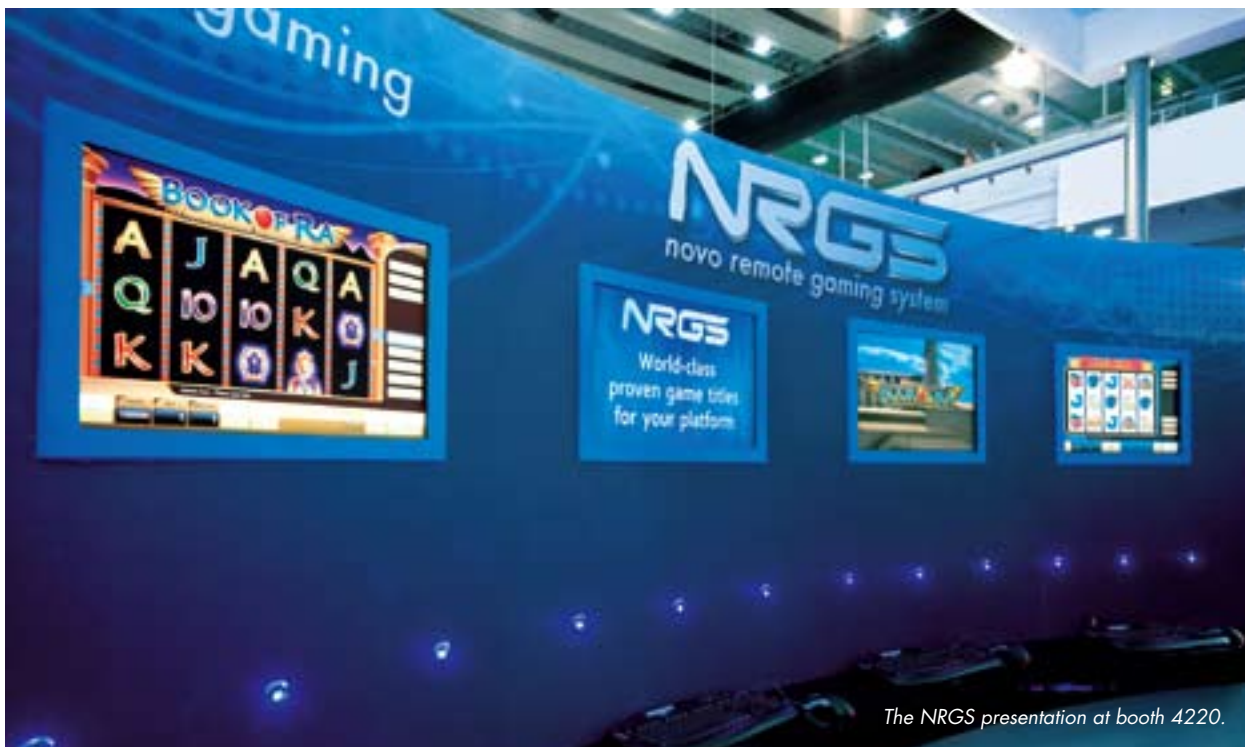
The NRG3 presentation at booth 4220.