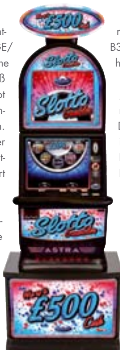
Slotto Gambler, Category B3.

Die gebündelten Energien des Astra-Entwicklungsteams brachten zahlreiche video- und walzenbasierte Category C-Spiele hervor: der faszinierende neue ‚Diva’s Reels‘-Multiplayer begeisterte das Publikum mit frischem Design und benutzerfreundlicher Spielunterhaltung. Auch die Category C-3-Walzen-Single-Player Pure Gold, Reel King Player und Diva’s Reels Player begeisterten mit ihrem Mix von traditionellen Walzen und zeitge-