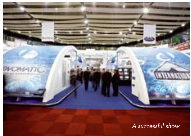
A successful show.