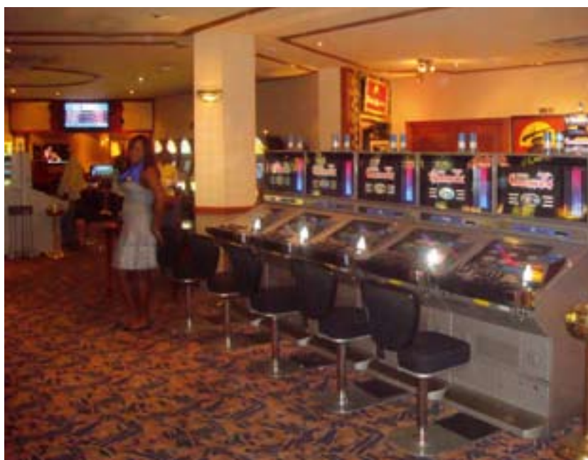
KaiRo International’s La Palm Casino.