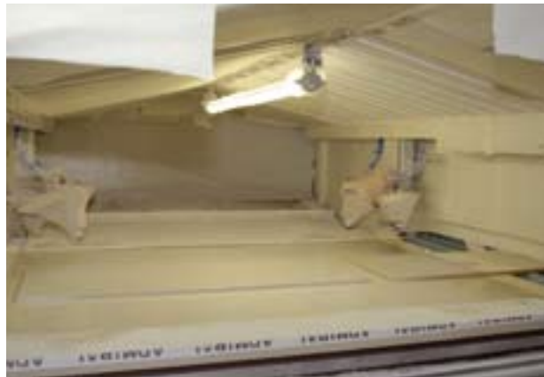
The modern paint-spray line, fully automated.

Fräs- und Bohrmaschine sowie einer umweltfreundlichen Lackierstraße, die der ganze Stolz von Tischlerei-Leiter und Chefdesigner Christian Bauer ist: „Diese neue 600.000-Euro-Lackierstraße ist eine vollautomatisierte Industriemaschine, die uns den Umstieg von manuellen und lösungsmittelbasierten Lackierarbeiten auf eine vollautomatisierte, wasserbasierte Lackieranlage ermöglicht hat. Sie bietet nicht nur wirtschaftliche Vorteile, wie reduzierten Personalaufwand durch die Automatisierung, sondern auch wesentliche Vorteile in Bezug auf Arbeitsschutz und Umweltschutz.“ Die neue Lackierstraße ermöglicht eine 30-prozentige Lackrückgewinnung. Dadurch verhalf die Anlage dem Unternehmen zu einer Reduktion des jährlichen Lackbedarfs von 29 Tonnen auf nunmehr 22,5 Tonnen und ist damit ein wichtiger Erfolgsfaktor für die neue umweltfreundliche Novomatic-Tischlerei. ■