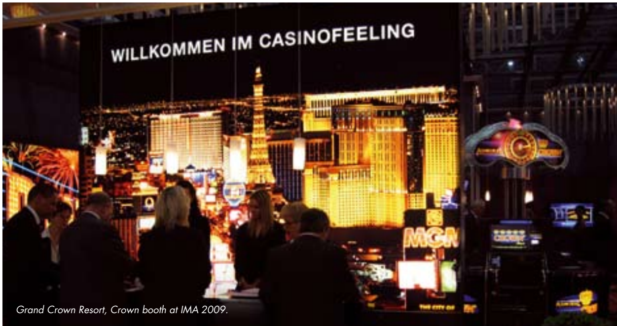
Grand Crown Resort, Crown booth at IMA 2009.