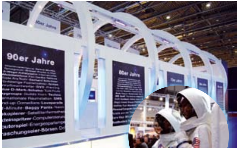
The LÖWEN TimeTunnel at IMA 2009.