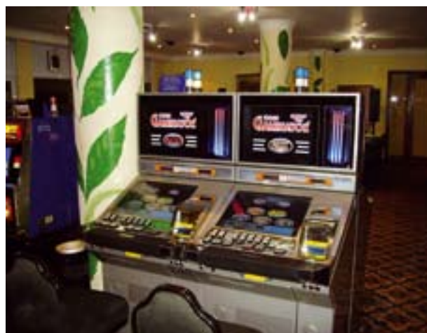
Novomatic gaming equipment in KaiRo International operations, top: Casino Safari and below: New Africa Casino.