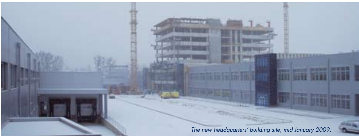
The new headquarters' building site, mid January 2009.

Fräs- und Bohrmaschine sowie einer umweltfreundlichen Lackierstraße, die der ganze Stolz von Tischlerei-Leiter und Chefdesigner Christian Bauer ist: „Diese neue 600.000-Euro-Lackierstraße ist eine vollautomatisierte Industriemaschine, die uns den Umstieg von manuellen und lösungsmittelbasierten Lackierarbeiten auf eine vollautomatisierte, wasserbasierte Lackieranlage ermöglicht hat. Sie bietet nicht nur wirtschaftliche Vorteile, wie reduzierten Personalaufwand durch die Automatisierung, sondern auch wesentliche Vorteile in Bezug auf Arbeitsschutz und Umweltschutz.“ Die neue Lackierstraße ermöglicht eine 30-prozentige Lackrückgewinnung. Dadurch verhalf die Anlage dem Unternehmen zu einer Reduktion des jährlichen Lackbedarfs von 29 Tonnen auf nunmehr 22,5 Tonnen und ist damit ein wichtiger Erfolgsfaktor für die neue umweltfreundliche Novomatic-Tischlerei. ■