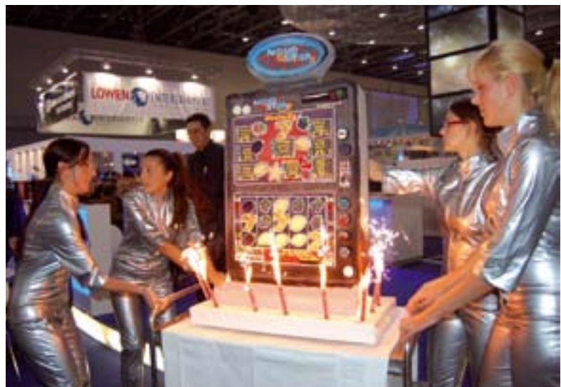
The NOVO STAR II.