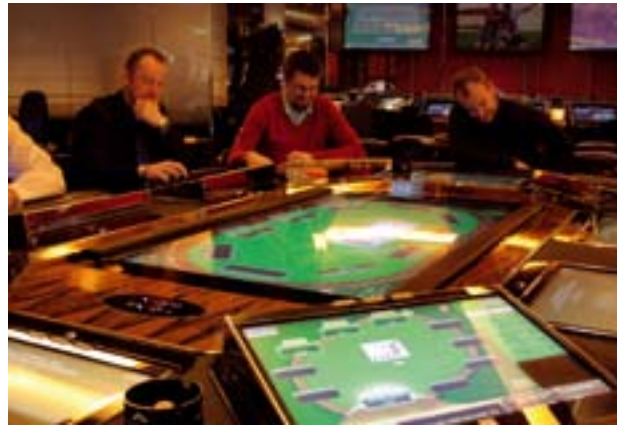
The new handcrafted Brazilian rosewood table.